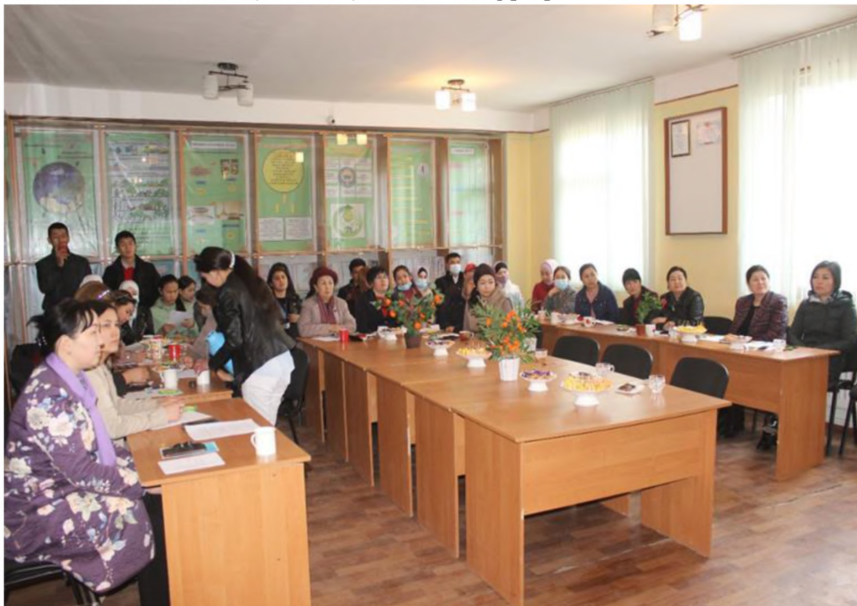
1-сүрөт- Б.Сыдыков атындагы Кыргыз-Өзбек эл аралык университетинде өткөрүлгөн эксперимент учуру.

Анкета жүргүзүү студенттердин толерантуулугу тууралуу билимдерин аныктоо максатында когнитивдик (билимдик) деңгээде өткөрүлдү.