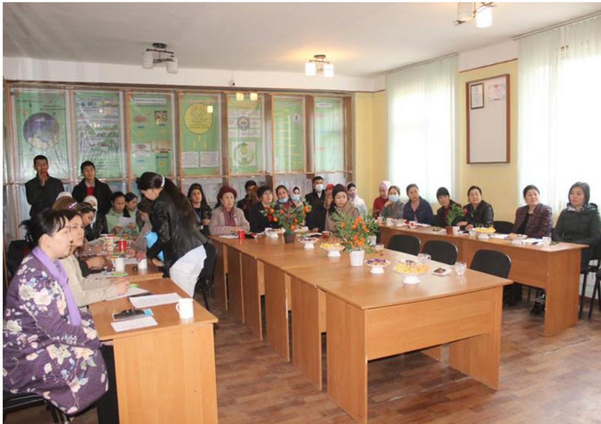
1-сүрөт- Б.Сыдыков атындагы Кыргыз-Өзбек эл аралык университетинде өткөрүлгөн эксперимент учуру.

Анкета жүргүзүү студенттердин толерантуулугу тууралуу билимдерин аныктоо максатында когнитивдик (билимдик) деңгээде өткөрүлдү.