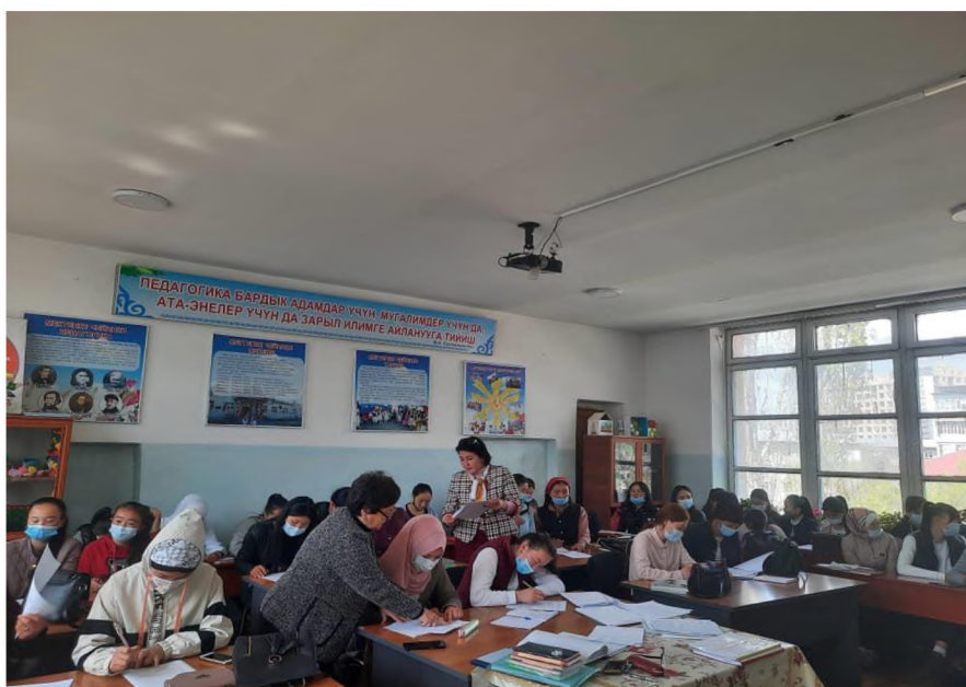
3-сүрөт- Ош мамлекеттик педагогикалык университетинин колледжиндеги студенттер арасында анкета, тест аркылуу эксперимент жүргүзүү учуру.

Биздин изилдөөлөрүбүздө каралган жогоруда аталган бардык мамилелер жана усулдар тажрыйбалык-эксперименталдык ишти жүргүзүү үчүн негиз катары кызмат кылды, ал 3 этапта жүргүзүлүп: констатациялык, педагогикалык (калыптандыруучу) жана текшерүүчү эксперименттерди түздү. Мына ушуга байланыштуу, биздин изилдөө усулдарыбыздын жана мамилелерибиздин натыйжалуулугун жана ишенимдүүлүгүн белгилөөдө жогорку билимдүү илимдин кандидаттары жакшы сунуштарын берип кетишти [7].