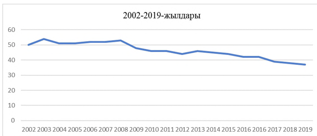
2-сүрөт. Жаш аялдардын жумуш менен камсыз болуусу

Кыргыз бизнесинде салттуу эркектик сапаттар сакталып калганын статистика толугу менен тастыктайт. «Кыргыз Республикасынын статистикалык бирдиктеринин бирдиктүү мамлекеттик реестринин» маалыматы боюнча ишкердик менен алектенген эркектердин үлүшү 64,6%ды, аялдар 35,4%ды түзөт (3-таблица).